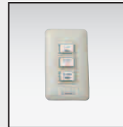
● ワイヤードスイッチ(S-3)