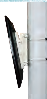
クッション付きなので柱を痛めることなく取付可能!