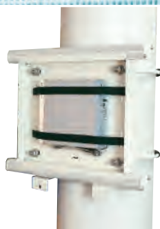
付属のマジックベルトで機器の収納が可能!