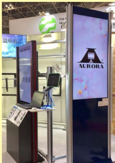
フロントボックスタイプ