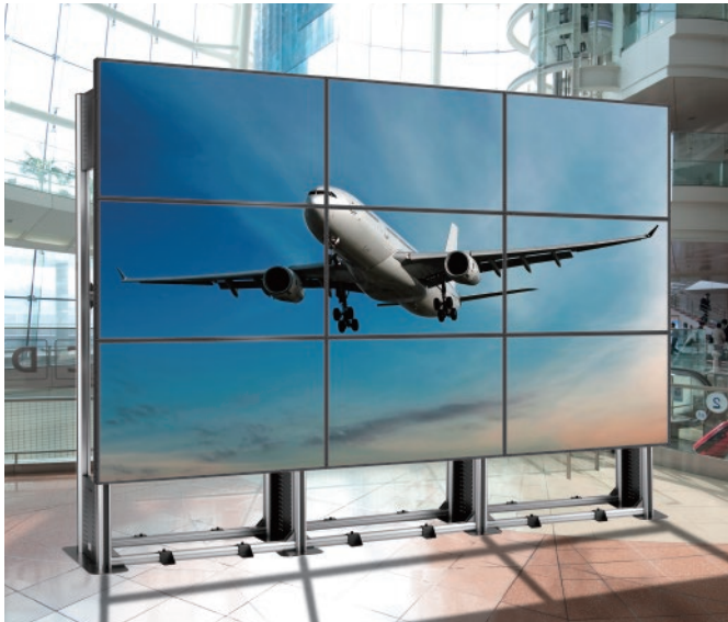
■サインージフレーム