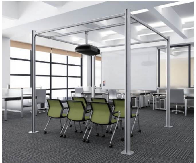
■プレゼンテーションスペースフレーム