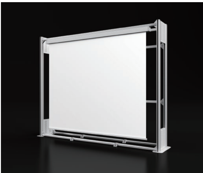
■スクリーン設置フレーム