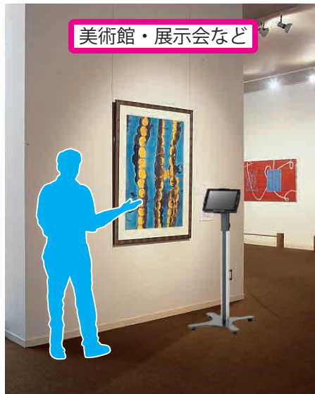
美術館・展示会など